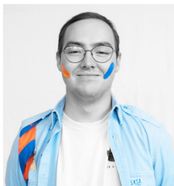
Obi Patoor Mandelstraat 2 0495/26.97.29