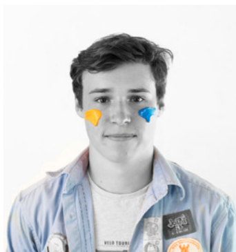
Staf Houthoofd Sint-Elooisstraat 52 0475/68.63.53