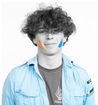
Tuur vanaele Kwadestraat 16a 0493/45.03.01